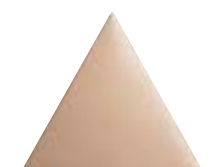
FIGURES TRIANGLE BRONZE 15,9 x 18 (G 54) 6,3" x 7" m²