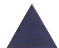
FIGURES TRIANGLE BLEU 15,9 x 18 (G 64) 6,3" x 7" m²