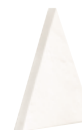
ANGULOS RECTOS STRAIGHT EDGES