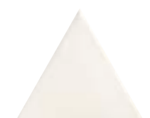
FIGURES TRIANGLE BLANC 15,9 x 18 (G 42) 6,3" x 7" m²