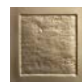
FIGURES QUADRAT ORO 15,5 x 15,5 (G 46) 6" x 6" m²