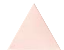
FIGURES TRIANGLE ROSAT 15,9 x 18 (G 64) 6,3" x 7" m²