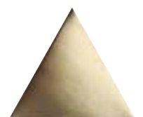
FIGURES TRIANGLE ORO 15,9 x 18 (G 54) 6,3" x 7" m²