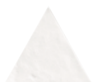
FIGURES TRIANGLE NATURAL 15,9 x 18 (G 42) 6,3" x 7" m²