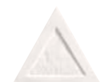
FIGURES TRIANGLE DOBLE 15,9 x 18 (G 42) 6,3" x 7" m²