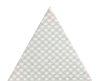
FIGURES TRIANGLE ARC 15,9 x 18 (G 42) 6,3" x 7" m²