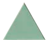
FIGURES TRIANGLE POMME 15,9 x 18 (G 64) 6,3" x 7" m²