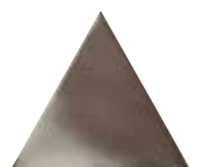
FIGURES TRIANGLE PLATA 15,9 x 18 (G 54) 6,3" x 7" m²