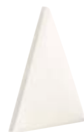
ANGULOS REDONDEADOS ROUNDED EDGES