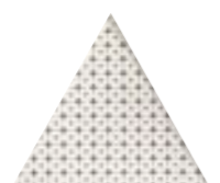
FIGURES TRIANGLE ESTEL 15,9 x 18 (G 42) 6,3" x 7" m²