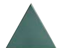
FIGURES TRIANGLE VERT 15,9 x 18 (G 64) 6,3" x 7" m²