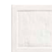
FIGURES QUADRAT DOBLE 15,5 x 15,5 (G 60) 6" x 6" m²