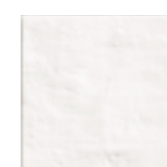
FIGURES QUADRAT NATURAL 15,5 x 15,5 (G 60) 6" x 6" m²