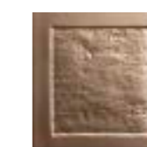
FIGURES QUADRAT BRONZE 15,5 x 15,5 (G 46) 6" x 6" m²