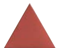
FIGURES TRIANGLE CARMIN 15,9 x 18 (G 64) 6,3" x 7" m²