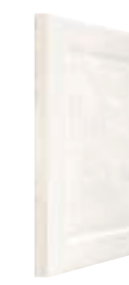
ANGULOS RECTOS STRAIGHT EDGES