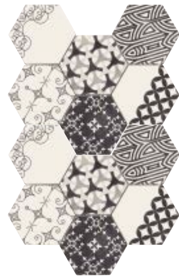
MODELI MIX HEX. 15 x 17 (G 54) 6" x 7" m