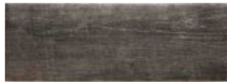
TECH RAIL TEAK 21 x 60 (G 58) 8" x 23,6" m²