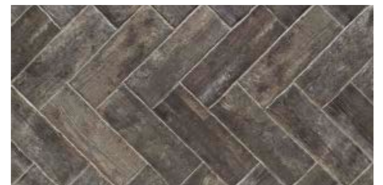
TECH RAIL TEAK