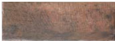
TECH RAIL CHERRY 21 x 60 (G 58) 8" x 23,6" m²