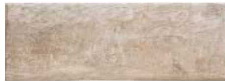
TECH RAIL ASPEN 21 x 60 (G 58) 8" x 23,6" m²