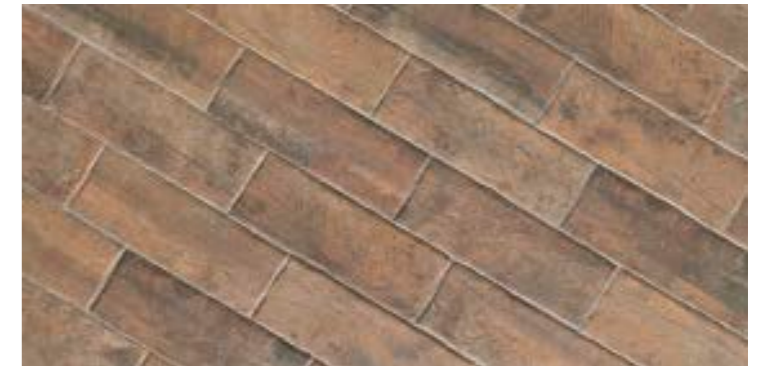
TECH RAIL NUT