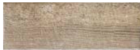
TECH RAIL WILLOW 21 x 60 (G 58) 8" x 23,6" m²