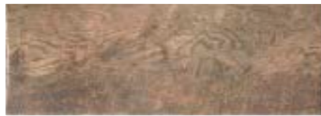
TECH RAIL NUT 21 x 60 (G 58) 8" x 23,6" m²