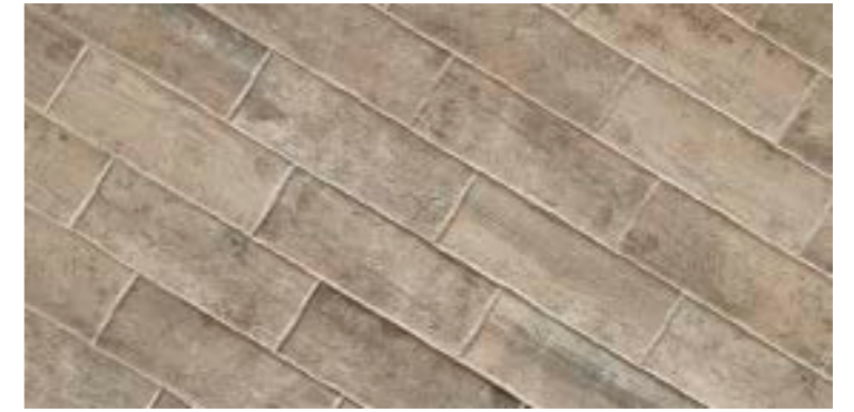
TECH RAIL WILLOW