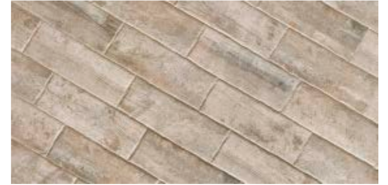
TECH RAIL ASPEN