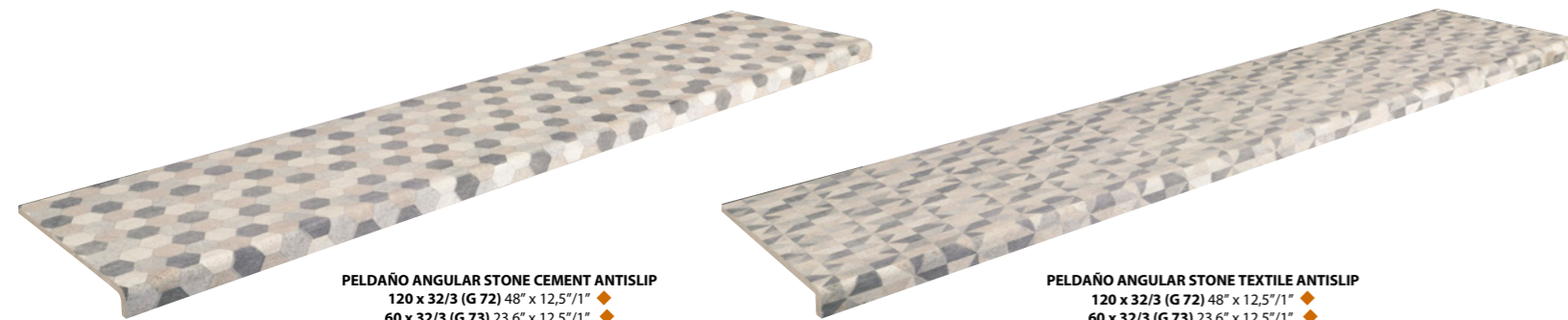
PELDAÑO ANGULAR STONE CEMENT ANTISLIP 120 x 32/3 (G 72) 48" x 12,5"/1" ♦ 60 x 32/3 (G 73) 23,6" x 12,5"/1" ♦